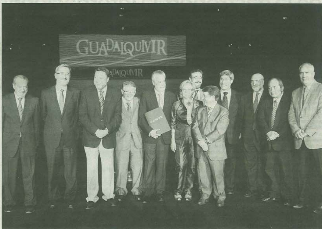
Foto de familia de los firmantes del protocolo del Proyecto Guadalquivir, con José Antonio Griñán en el centro, ayer en Sevilla.

Esas estaciones están incluidas en los tres grandes nodos en que se ha dividido el río: Nodo del Guadalquivir Alto (Ventana de la Sierra), Nodo del Guadalquivir de la