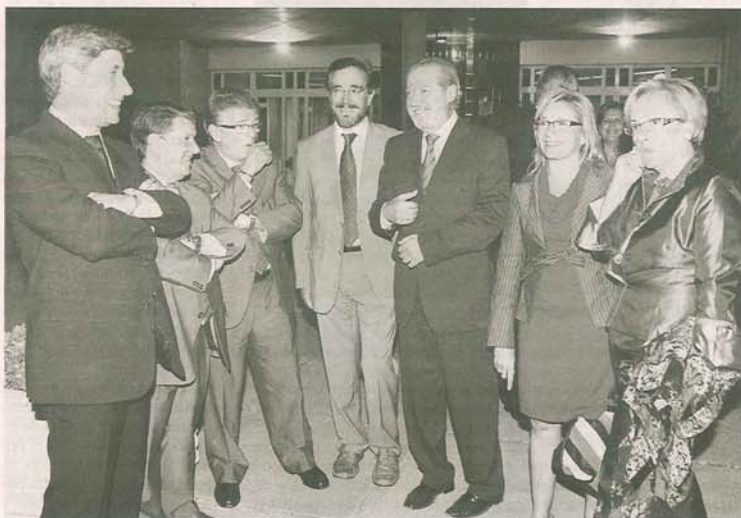
Los presidentes de las diputaciones implicadas en el proyecto.