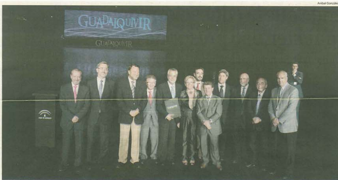
José Antonio Griñán presidió ayer en el CAR de la Cartuja en Sevilla la constitución del consorcio, a la que asistieron todos sus integrantes