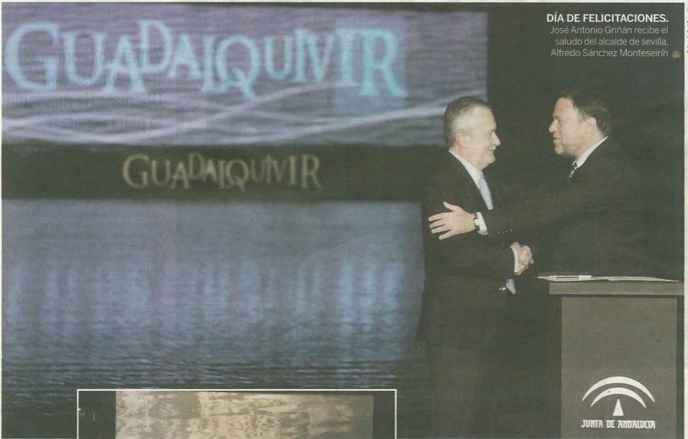
DÍA DE FELICITACIONES. José Antonio Griñán recibe el saludo del alcalde de Sevilla, Alfredo Sánchez Monteseirín