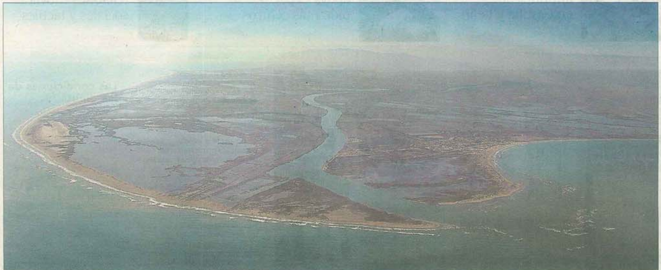
Vista aérea de la desembocadura del Ebro, en Tarragona.